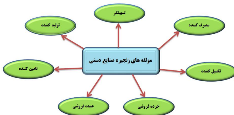
شکل ۱. مولفه های مورد بررسی زنجیره ارزش صنایع دستی (International Trade Centre (ITC), 2011)

زنجیره ارزش صنایع دستی، یک سیستم اقتصادی شامل مجموعه ای از فعالین و فعالیت های تجاری است که کسب و کار آن ها در امتداد یکدیگر، موجب تکامل و تجارت محصول، از تولیدکنندگان ابتدایی به مصرف کنندگان نهایی می شود و برای هر یک از فعالان شبکه، ارزش اقتصادی خلق می کند. از طرفی، صنعت گردشگری نیز به عنوان نزدیک ترین صنعت به صنایع دستی است که می تواند در جهت ایجاد و گسترش بازار صنایع دستی، نقش حیاتی ایفا کند. شاخص های زنجیره ارزش صنایع دستی در این پژوهش شامل موارد زیر هستند (International Trade Centre (ITC), 2011) (شکل ۱).