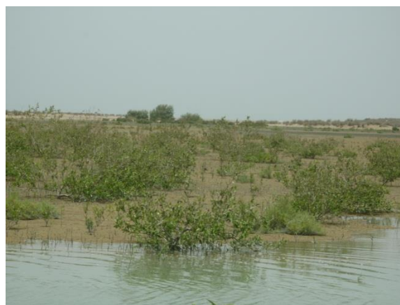
شکل ۲. نمایی از توده‌های جنگلکاری در خور تیس چابهار

بررسی تحلیل روند پایداری رویشگاه‌های دست کاشت مانگرو در استان سیستان و بلوچستان در ۵ گام زیر به انجام رسید: ۱- شناسایی مشخصات توده‌های دست کاشت مانگرو در استان: برای این منظور با بررسی منابع اطلاعاتی موجود در اداره کل منابع طبیعی و آبخیزداری استان و همچنین بازدید میدانی، ویژگی‌های محیطی جنگل‌کاری‌های مانگرو در دو بخش توسعه و واکاری در سواحل استان شناسایی شد (شکل ۲).