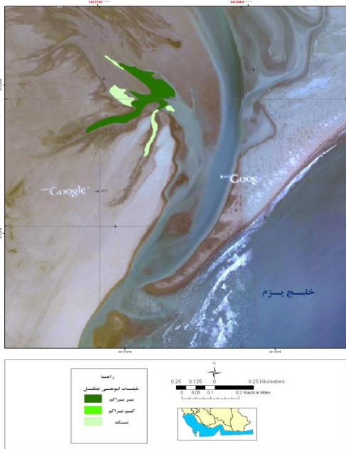
شکل ۴. پهنه‌های جنگکاری در خور راشدی