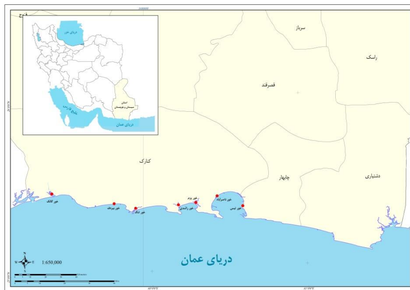
شکل ۱. موقعیت رویشگاه‌های در دست کاشت مانگرو در سواحل استان سیستان و بلوچستان

بررسی تحلیل روند پایداری رویشگاه‌های دست کاشت مانگرو در استان سیستان و بلوچستان در ۵ گام زیر به انجام رسید: ۱- شناسایی مشخصات توده‌های دست کاشت مانگرو در استان: برای این منظور با بررسی منابع اطلاعاتی موجود در اداره کل منابع طبیعی و آبخیزداری استان و همچنین بازدید میدانی، ویژگی‌های محیطی جنگل‌کاری‌های مانگرو در دو بخش توسعه و واکاری در سواحل استان شناسایی شد (شکل ۲).