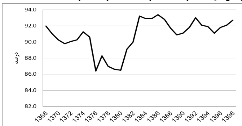
شکل ۱- نرخ اشتغال در مناطق روستایی

در این مقاله، روند اشتغال در مناطق روستایی طی دوره ۱۳۶۸-۱۳۹۸ با تأکید بر مقاطع برنامه‌های پنج ساله مورد تحلیل قرار می‌گیرد. میانگین نرخ اشتغال در این دوره ۹۰/۸ درصد بوده و دلالت بر این دارد که نرخ بیکاری بلندمدت در مناطق روستایی تک رقمی با میانگین ۹/۲ درصد است. روند تغییرات نرخ اشتغال در مناطق روستایی در شکل (۱) ترسیم شده است. کمترین نرخ‌های اشتغال در سال‌های ۱۳۷۶ و ۱۳۷۹ به ترتیب با ۸۶/۴ و ۸۶/۶ درصد و بیشترین نرخ‌های اشتغال در سال‌های ۱۳۸۳ و ۱۳۸۶ به ترتیب با ۹۳/۲ و ۹۳/۴ درصد ثبت شده است.