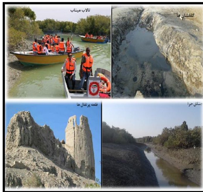
شکل ۲- عکس‌هایی از ژئومورفوسایت‌های انتخابی شهرستان میناب

برای ارزیابی برخی معیارهای علمی و مکمل همانند در دسترس بودن، بکر بودن، قابلیت مشاهده و ...، مشاهدات ارزیاب (در اینجا نگارندگان)، از طریق نرم افزار GIS، نقشه و مشاهدات میدانی متقن است و نیازی به کارشناس و نظر خواهی دیگران ندارد. اما برای برخی از معیارهای ژئومورفوسایت‌ها همچون محافظت، مدیریت و زیبایی‌شناسی باید از نظر کارشناسان متخصص و مدیر که به منطقه آشنایی کامل دارند استفاده شود. برای این منظور جامعه آماری این پژوهش از کارشناسان، مدیران، صاحب‌نظران و خبرگان عرصه گردشگری انتخاب شده‌اند که با حضور در محل کار به صورت حضوری و یا غیر حضوری و تلفنی از ایشان مصاحبه صورت گرفته است. ۳ نفر از اساتید عرصه گردشگری دانشگاه هرمزگان، ۷ نفر از مدیران و کارشناسان اداره کل استان و اداره شهرستان میناب و ۵ نفر از خبرگان و علاقمندان به طبیعت انتخاب شده و در پاره ای از معیارها نظرخواهی شده است. نمره کل معیار با توجه به پاسخ نظر سنجی لحاظ شده است. عوارض ژئومورفولوژیک منطقه مورد مطالعه در (جدول ۸) لیست شده است.