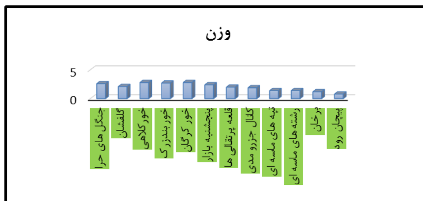
شکل ۳- نمودار معیار علمی ژئومورفوسایت‌های دشت میناب با استفاده از مدل رینارد