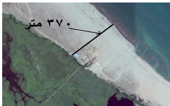
تصویر ۱ - اراضی شنزار ساحلی (پلاژ) در شمال کیاشهر

چنان که پیداست میانگین سطح آب از منفی ۲۶.۵۹ متر در مهر سال ۱۳۹۱ به منفی ۲۶.۸۹ متر در مهر سال ۱۳۹۴ رسیده یعنی در مجموع ۳۰ سانتی متر کاهش یافته است. بدین ترتیب ما اکنون طبق داده‌های ثبت شده توسط وزارت نیرو و به ویژه مرکز ملی مطالعات و تحقیقات دریای خزر می‌دانیم که از نیمه‌ی دهه‌ی ۱۳۷۵ تا نیمه‌ی دهه ۱۳۹۰ پسروری آب دریا خزر به طور مستمر ادامه یافته است. به طوری که بیش از یک متر یا به طور دقیق یک متر و بیست سانتی‌متر از ارتفاع سطح دریای خزر کاسته شده و پیداست که اراضی قابل توجهی در اثر این پسروری از آب بیرون آمده است و «داغ آب» های ساحلی نیز این زمین‌ها را در کرانه‌ی ساحلی دریای خزر به خوبی نشان می‌دهد. برای نمونه در تصویر ۱ بخشی از این اراضی شنزار که به صورت داغ آب در شمال کیاشهر در دهانه‌ی رودخانه‌ی سفیدرود در گیلان واقع شده نشان داده شده است. در اینجا اکنون عرض این داغ آب ها نه به ۶۰ متری یعنی پهنای حریم اعلام شده از دهه‌ی ۱۳۴۰ بلکه به بیش از ۶ برابر آن یعنی بیش از ۳۶۰ متر رسیده است.