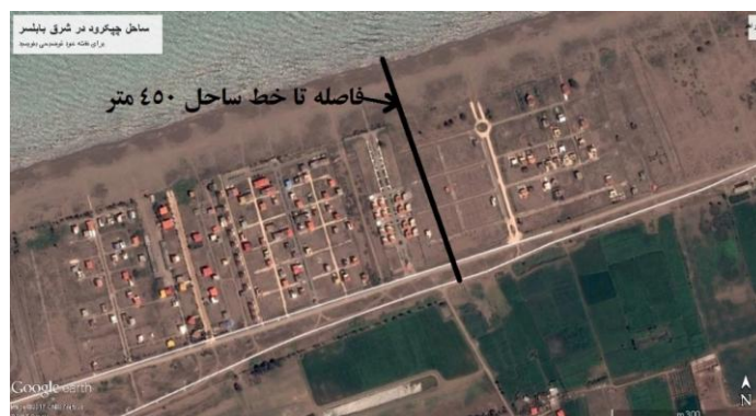
تصویر ۲- شهرک ساخته شده در اراضی مستحدث ساحل چپ‌کرد در شرق بابلسر

چنانچه مشاهده می‌شود پهنای داغ آب‌ها در این قسمت به بیش از ۴۵۰ متر می‌رسد. این ساخت و سازها از نیمه‌ی دوم دهه‌ی ۱۳۸۰ انجام شده است. بررسی عکس‌های تاریخی نشان می‌دهد که در عکس‌های سال ۱۳۸۴ در این ساحل هیچ سازه‌ی مهمی وجود نداشته است. اما در فاصله‌ی ده‌ساله‌ی بین ۱۳۸۴ تا ۱۳۹۳ این سازه‌ها بر روی اراضی ساحلی پیدا شده‌اند. در نقشه‌ی ۱ که از تغییرات تصاویر ماهواره‌ای سال ۲۰۰۵ با ۲۰۱۴ تهیه شده، ساخت و سازها را در این ساحل باهم مقایسه کرده است. در نقشه‌ی ۱، نقشه‌ی بالا متعلق به سال ۱۳۸۴ و نقشه‌ی پایین به سال ۱۳۹۳ تعلق دارد. ۱